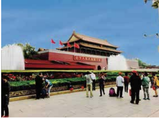
北京故宮，即紫禁城，天安門是明清兩代北京皇城的正門