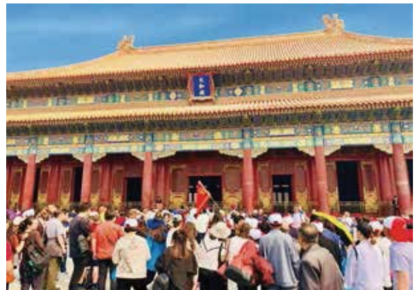
太和殿俗稱「金鑾殿」，明初稱「奉天殿」，後稱「皇極殿」，清朝時稱「太和殿」