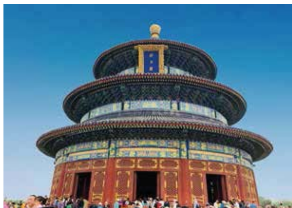
祈年殿是一座直徑32.72米的圓形建築，鎏金寶頂藍瓦三重檐攢尖頂，層層收進，總高38米