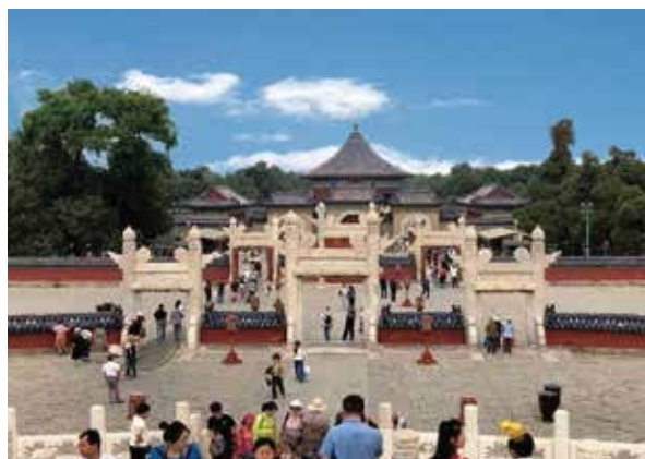
天壇佔地約273萬平方米，是故宮面積的四倍