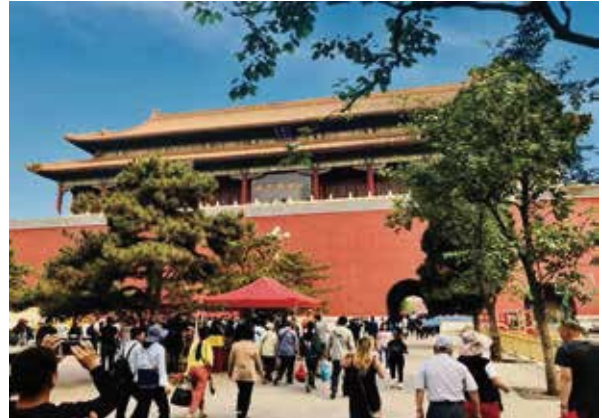
北京故宮為明成祖朱棣於公元1406年下令全面建造