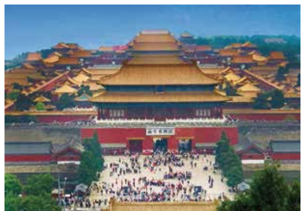
從景山公園望向北京故宮