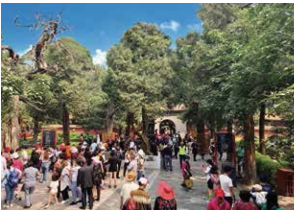
御花園建於明代，為皇宮的宮廷花園