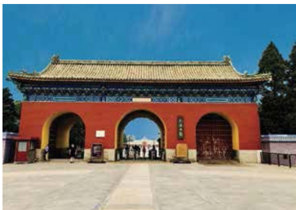
天壇是明清兩朝帝王祭天、祈穀和祈雨的場所