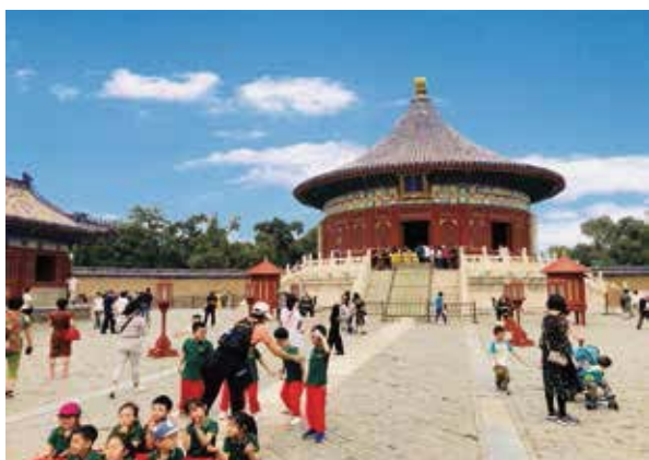
皇穹宇的外觀狀似圓亭，坐落在2米多高的漢白玉須彌座台基上，周圍均設石護欄