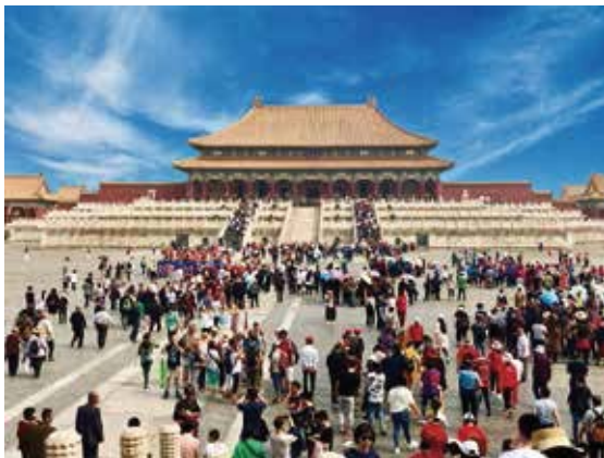
明、清兩代合共二十四位皇帝都曾經居住於此五百餘年